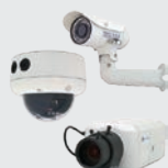
Cámaras IP Illustra